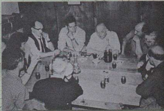
Besprechung der Hüttenübernahme – 1968