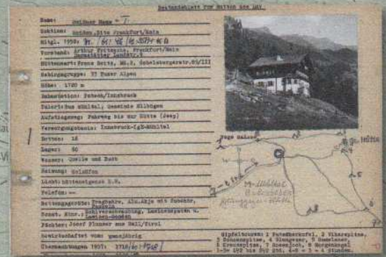
DAV Hüttenbestandsblatt – 1958