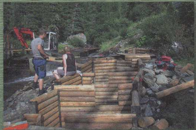
Bau der Fischtreppe – 2015