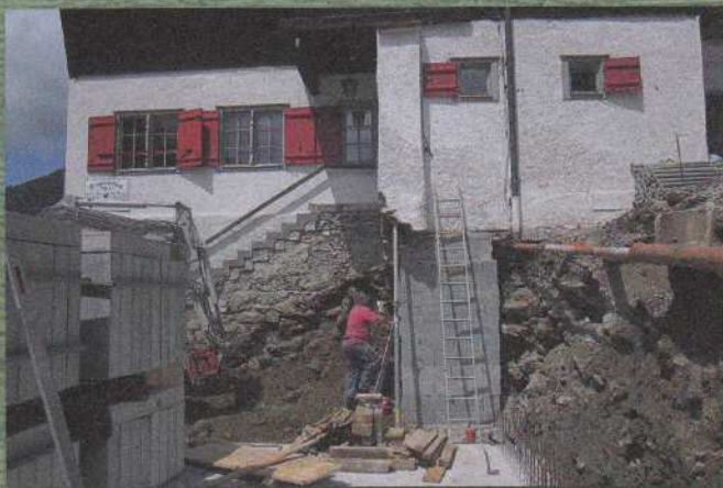
Neubau Seminarraum – 2015